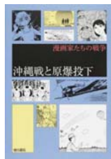
沖縄戦と原爆投下 中澤啓治、比嘉憑 他

広島出身の女優・綾瀬はるか、が、広島、長崎の被爆者や、沖縄戦の関係者らのもとを訪ねて聞いた戦争の記憶。