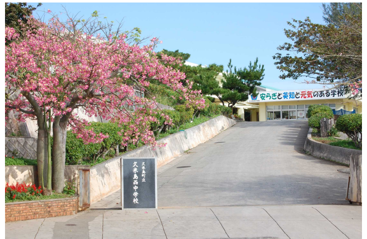
久米島町立 久米島西中学校